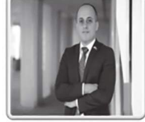
Abdulla Momade MOZAMBIQUE