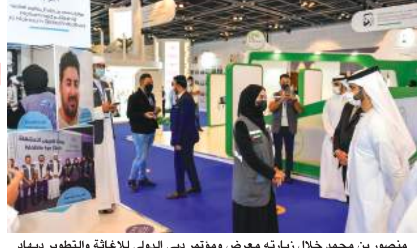
منصور بن محمد خلال زيارته معرض ومؤتمر دبي الدولي للإغاثة والتطوير ديهاد

دبي-وايم: استشاري العلمي العالمي «ديساب»، بجولة في المعرض الذي يشارك فيه أكثر من ٦٠٠ من الشركات وهيئات الإغاثة والمنظمات الحكومية وغير الحكومية والجمعيات الخيرية والإنسانية والمنظمات غير الربحية، إضافة إلى ممثلي منظمات الأمم المتحدة والمؤسسات المختصة في المجال العمل الإغاثي من أكثر من ٨٠ دولة حول العالم. واطلع سموه خلال الجولة على مستجدات المبادرات والابتكارات في مجال العمل الإنساني والإغاثي في منصة مؤسسة خليفة بن زايد الخيرية، حيث استمع إلى نبذة حول بعض المشاريع التي قامت بها المؤسسة في سياق دعم البرامج التعليمية والصحية والإغاثية والتنمية. زار سمو الشيخ منصور بن محمد بن راشد آل مكتوم، رئيس اللجنة العليا لإدارة الأزمات والطوارئ في دبي، صباح امس فعاليات اليوم الختامي للدورة السابعة عشرة من معرض ومؤتمر دبي الدولي للإغاثة والتطوير «ديهاد»، والذي نظمه مؤسسة «اندكس» لتنظيم المؤتمرات والمعارض - عضو في اندكس القابضة تحت شعار «الإغاثة وفيرس كورونا، أفريقيا محورا»، في الفترة من 15-17 مارس في مركز دبي التجاري العالمي. وقام سموه، برفاقه الدكتور عبدالسلام المدني، الرئيس التنفيذي لمعرض ومؤتمر دبي الدولي للإغاثة والتطوير «ديهاد»، والمجلس