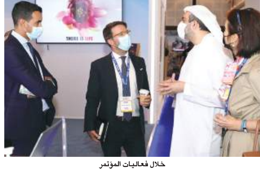
خلال فعاليات المؤتمر