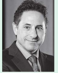
رأس الخيمة - وام:

«راکز» تطلق باقتها المخصصة لرواد الأعمال في مجال الألعاب الإلكترونية