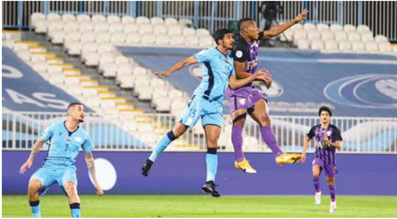
أرقام من الجولة ٢١:

شهدت الجولة ٢١، أكبر عدد من الكرات الركنية في مسابقة دوري هذا الموسم، بعدما احتسبت ٨٢ ركنية خلال المباريات السبع للجولة. - بلغت دقة تمرير سيريرو، لاعب الجزيرة، أمام الفجيرة ٩٢٪، من جملة تمريرات وصلت إلى ١٠٠ تمريرة. - شباب الأهلي حقق الفوز على الشارقة للمرة الأولى منذ ٢٠١٦ في دوري الخليج العربي. - شهدت الجولة ٢٧ هدفاً في ٧ مباريات، وبمتوسط تسجيل ٣,٨ هدف في المباراة الواحدة.