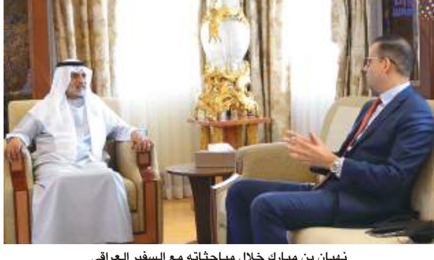
نهيات بن مبارك خلال مباحثاته مع السفير العراقي

أبوظبي-وايم: استقبل معالي الشيخ نهيات بن مبارك آل نهيات وزير التسامح والتعايش في قصره امس سعادة مظفر مصطفى الجبوري سفير جمهورية العراق لدى الدولة. وفي بداية اللقاء، رحب معاليه بالسفير العراقي وبحث سبل تعزيز العلاقات الاستراتيجية التي تربط دولة الإمارات العربية المتحدة وجمهورية العراق بما يخدم المصالح المشتركة كما تبادل وجهات النظر حول عدد من القضايا الإقليمية والدولية ذات الاهتمام المشترك. واستعرض الجانبان مستجدات جائحة كوفيد-19 والإجراءات الاحترازية والوقائية في البلدين وتدابير العمل المشترك لمواجهة تبعاتها. وأكد معالي الشيخ نهيات بن مبارك آل نهيات حرص دولة الإمارات على تعزيز علاقتها الاستراتيجية مع دول العالم انطلاقاً من مبادئ الأخوة الإنسانية التي تجسد قيمها الراسخة في التعايش والحوار والسلام والتضامن الإنساني بين المجتمعات والشعوب بما يحقق الأزدهار العالمي. وقال معاليه إن الإمارات حريصة على تنمية العلاقات الأخوية مع العراق الشقيق وتعزيز التعاون بين البلدين بما يحقق تطلعاتهما إلى مستقبل مزدهر ومشرق. من جانبه أكد سعادة السفير الدكتور مظفر مصطفى الجبوري حرص جمهورية العراق على تعزيز التعاون مع دولة الإمارات بما يخدم مصالح البلدين الشقيقين مشيداً بجهود الإمارات في إرساء قيم السلام والتسامح والتعايش على مستوى العالم بما يعزز مبادئ الأخوة الإنسانية. وأشاد سعادته بدور الإمارات الفاعل على الساحة الدولية من خلال تعزيز العمل الدولي المشترك لضمان وصول لقاح كوفيد 19 إلى جميع دول العالم في ظل الظروف الراهنة التي يشهدها العالم بما يضمن الحفاظ على صحة وسلامة الشعوب.