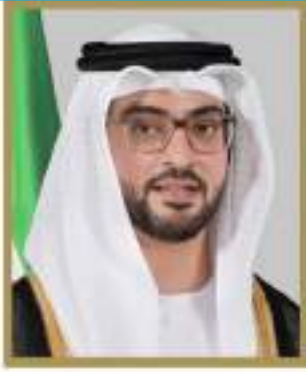
الشيخ سلطان بن حمدان بن زايد آل نهيان رئيس مجلس إدارة شركة نادي العين لكرة القدم